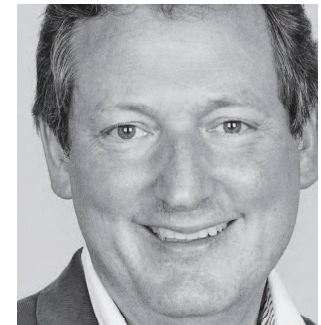
Eckart von Hirschhausen, Humorist und Arzt:*

„Martin Luther hat uns noch immer viel zu sagen: Rede verständlich, trau dich, deine Meinung zu sagen und stelle Dinge infrage - diese Freiheit brauchen wir heute genauso wie damals! Das Reformationsjubiläum bietet die Chance, Luther und den Geist der Freiheit neu zu entdecken, gegen Ideologien aufzubegehren und die Kraft von Gemeinschaft zu spüren.“