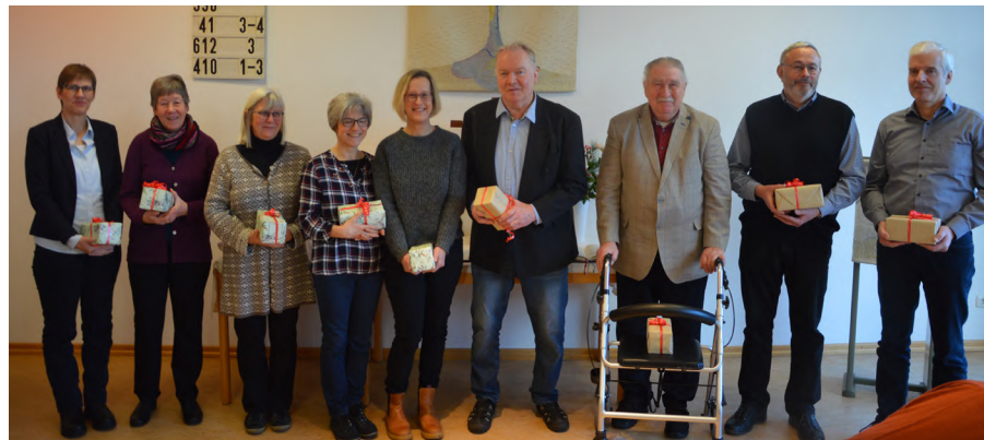
Der Kirchengemeinderat 2017-2023