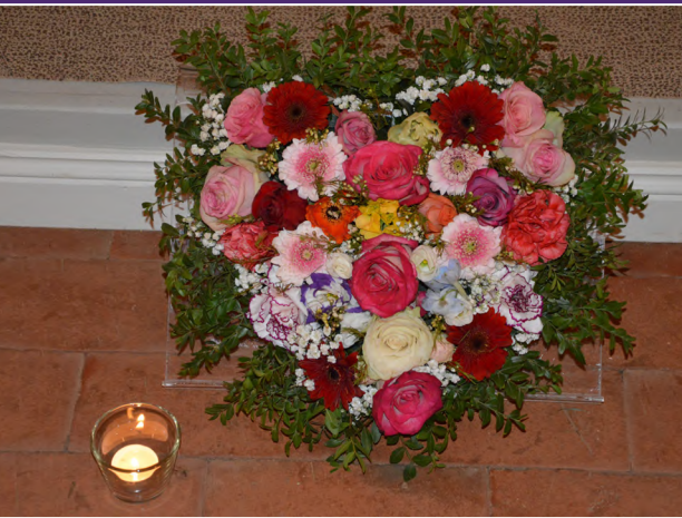
Worth (St.-Marien-Kirche) - Valentinsgottesdienst