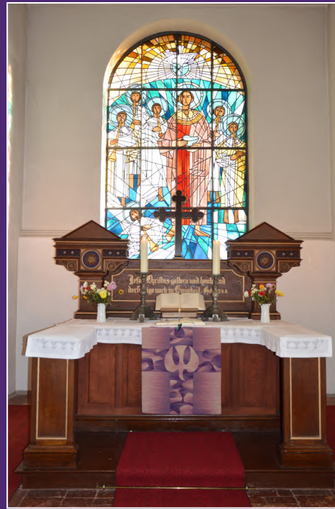
Hamwarde (St.-Jacobi-Kirche) - Passionszeit