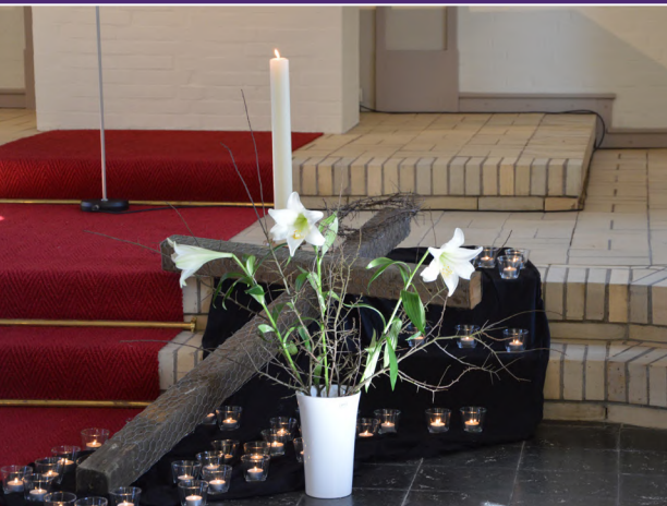
Gülzow (St.-Petri-Kirche) - Karfreitag