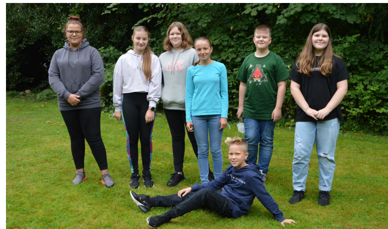
Gruppenfoto vom 04.09.2021 – Beginn der Konfi-Zeit