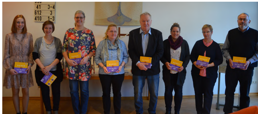
Der in sein Amt eingeführte Kirchengemeinderat: