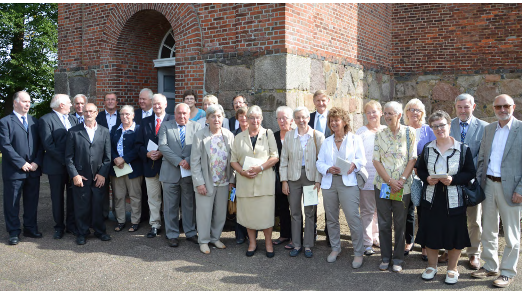
Goldene Konfirmandinnen und Konfirmanden vor der St.-Jacobi-Kirche zu Hamwarde im September 2016

Sonntag, 29. Mai 2022, 10:00 Uhr, Hamwarde