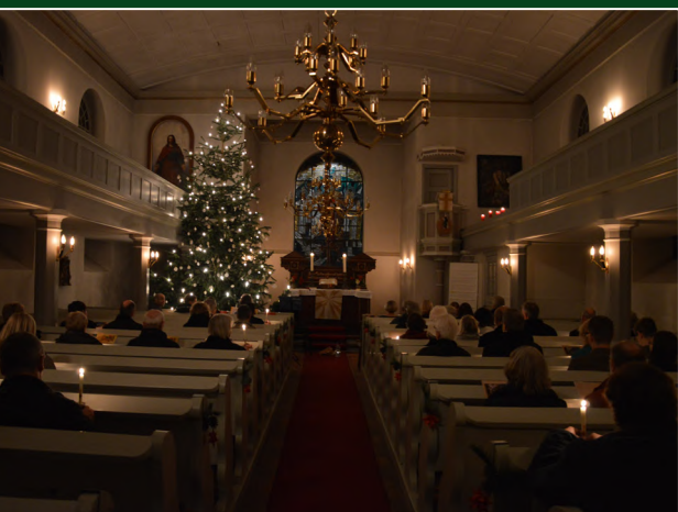
Christnacht in der St.-Jacobi-Kirche zu Hamwarde