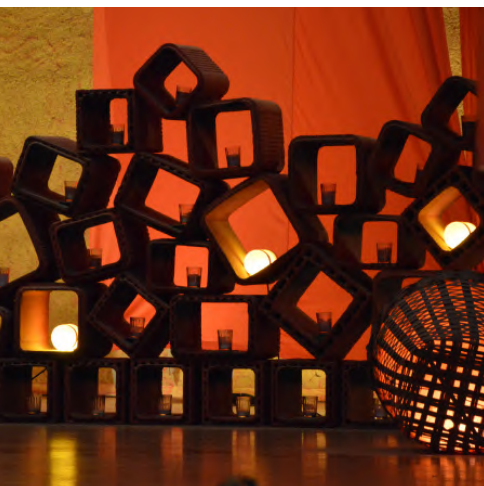
Altargestaltung in der Eglise de la Réconci- liation (Versöhnungskirche) in Taizé