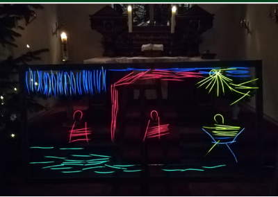
Hamwarde, Christnacht 2018 - Krippendarstellung aus Knicklichtern