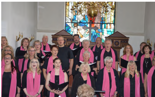
Fresh Old Gospelband, Sommermusik 2018, Hamwarde

Der Taizé-Gottesdienst be- schließt auch in diesem Jahr am Epiphantias-Tag, die „Nacht der Lichter“, das Weihnachtsfest. Wir erleben noch einmahl den Glanz des Weihnachtsfestes und feiern einen Abendgottesdienst mit Liedern und Gesängen der Communauté de Taizé in Bur- gund (Frankreich).