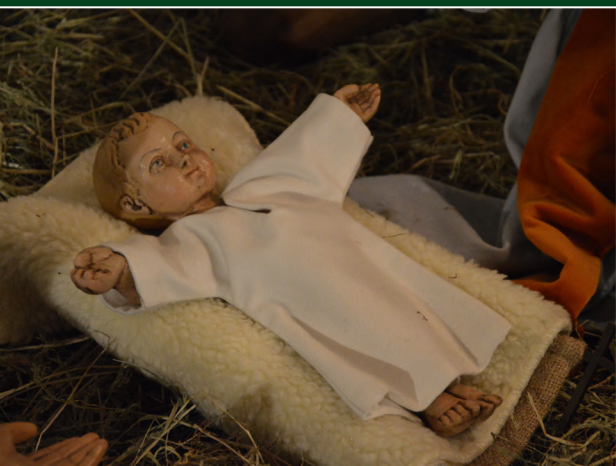
Das Christkind aus der Gülzower Weihnachtsskrippe (St.-Petri-Kirche)