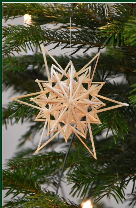
Christbaumschmuck in der St.-Marien-Kirche zu Worth