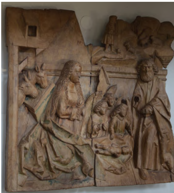
Geschnitzte Geburtszene in der Hamwarde Kirche