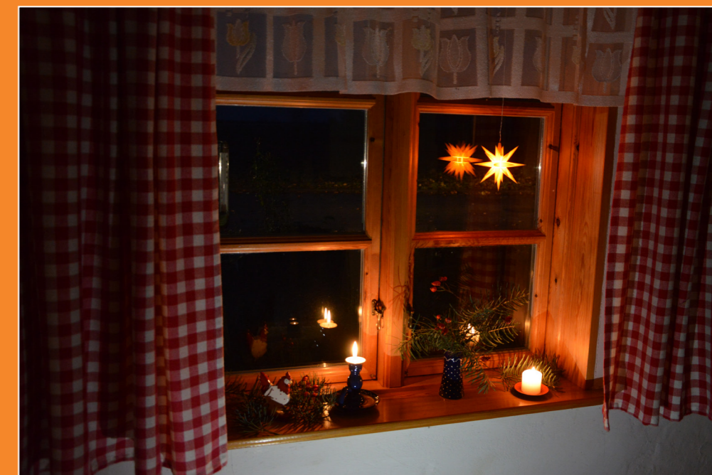
Wonach sehnst du dich?

Gemeindeinformationen der Evang.-Luth. Kirchengemeinde Gülzow